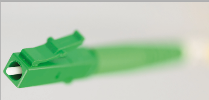
LC / APC