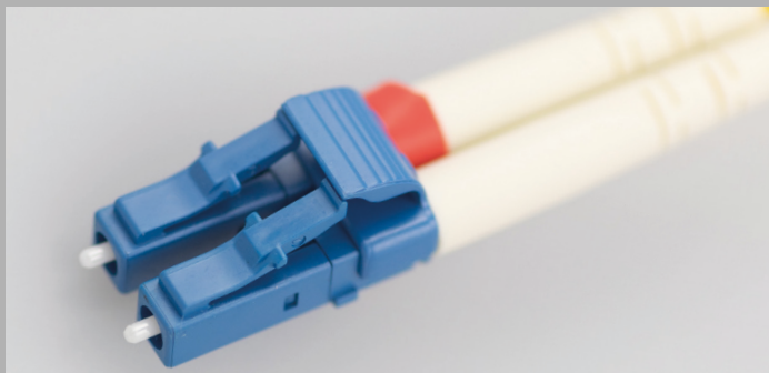
LC / PC